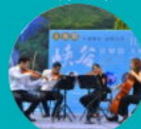
台北愛樂交響樂團